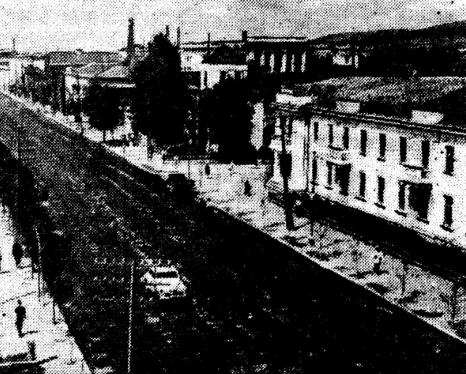
Украшаются и благоустраиваются города нашей Родины. НА СНИМКЕ: улица Ленина в городе Южно-Сахалинске.

М. АКСАКОВ, корреспондент «Литературной газеты» ДАРХАНЫ, Киргизская ССР