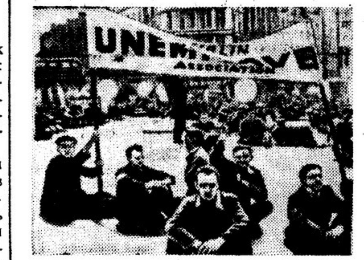
Безработные Дублина в знак протеста против нищенских пособий по безработице организовали демонстрацию на центральной площади города. Несколько часов они сидели на мостовой, нарушив уличное движение.

Трудящиеся Эйре жестоко страдают от безработицы. Ограничение торговли с демократическими странами государствам, правящим в кругах США, свертывание многих отраслей промышленности — таковы главные причины недостаточной занятости ирландских рабочих. Примерно одна восьмая часть трудящегося населения страны, пишет английская газета «Дейли уоркер», не имеет работы. Лишь незначительная часть ирландских безработных (только те, кто не работает очень давно) получает нищенские пособия. Остальные лишены всякой помощи и обрекаются на голод и нищету. Этим летом в столице Ирландии Дублине развернулось широкое движение протеста против безработицы и мизерных пособий, выплачиваемых государством. Ассо-